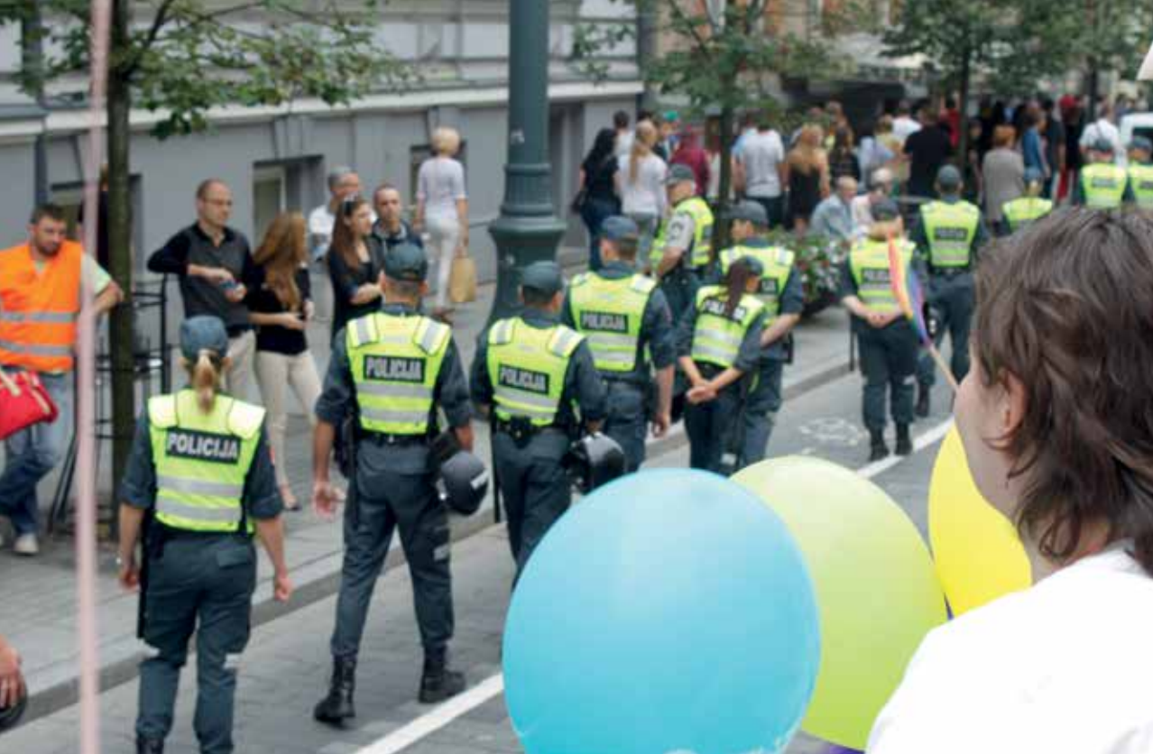
Ein massives Polizeiaufgebot schützte die rund 1000 TeilnehmerInnen der Baltic Pride im Juli 2013 in Vilnius, Litauen.